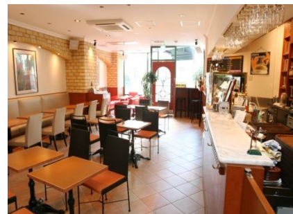
カフェ・ラ・コルテ カフェ&バー