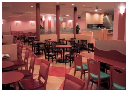
カフェ・ベローチェ セルフサービス式コーヒーショップ